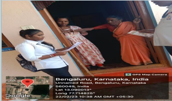
GPS Map Camera Bengaluru, Karnataka, India Unnamed Road, Bengaluru, Karnataka 560049, India Lat 13.090013° Long 77.714825° 22/02/23 10:38 AM GMT +05:30