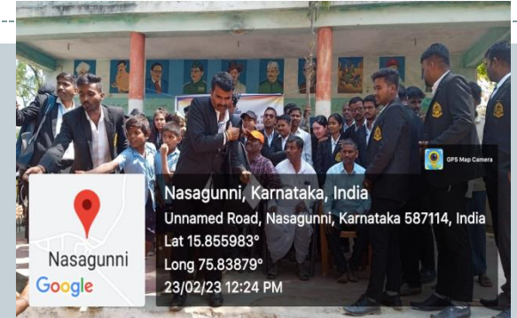
Nasagunni, Karnataka, India Unnamed Road, Nasagunni, Karnataka 587114, India Lat 15.855983° Long 75.83879° 23/02/23 12:24 PM