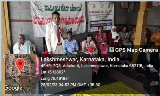
Lakshmeshwar, Karnataka, India 4FHR+7Q3, Adrakatti, Lakshmeshwar, Karnataka 582116, India Lat 15.12802° Long 75.49195° 25/02/23 04:52 PM GMT +05:30