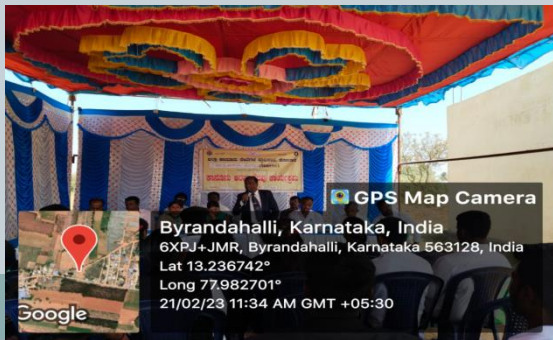
Byrandahalli, Karnataka, India 6XPJ+JMR, Byrandahalli, Karnataka 563128, India Lat 13.236742° Long 77.982701° 21/02/23 11:34 AM GMT +05:30