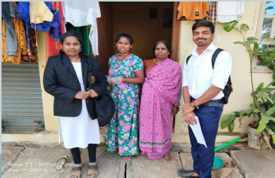
vivo T1 - Rudresh Patel Feb 9, 2023, 11:15