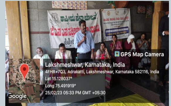
Lakshmeshwar, Karnataka, India 4FHR+7Q3, Adrakatti, Lakshmeshwar, Karnataka 582116, India Lat 15.128037° Long 75.491919° 25/02/23 05:33 PM GMT +05:30