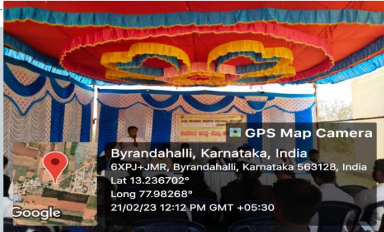
Byrandahalli, Karnataka, India 6XPJ+JMR, Byrandahalli, Karnataka 563128, India Lat 13.236702° Long 77.98268° 21/02/23 12:12 PM GMT +05:30