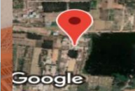
Bengaluru, Karnataka, India Unnamed Road, Bengaluru, Karnataka 560049, India Lat 13.090013° Long 77.714825° 22/02/23 10:38 AM GMT +05:30