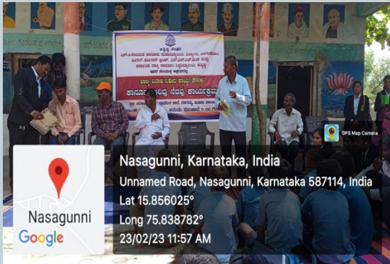
Nasagunni, Karnataka, India Unnamed Road, Nasagunni, Karnataka 587114, India Lat 15.856025° Long 75.838782° 23/02/23 11:57 AM