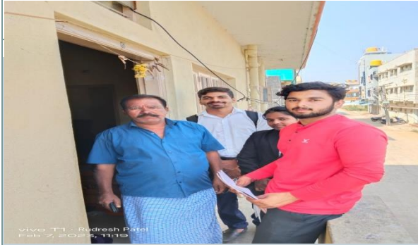
vivo T1 - Rudresh Patel Feb 9, 2023, 11:15