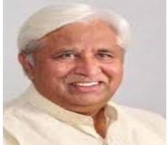
ಶ್ರೀ ಹೆಚ್. ಕೆ. ಪಾಟೀಲ ಸನ್ಮಾನ್ಯ ಕಾನೂನು, ನ್ಯಾಯ ಮತ್ತು ಮಾನವ ಹಕ್ಕುಗಳ ಸಚಿವರು 2023