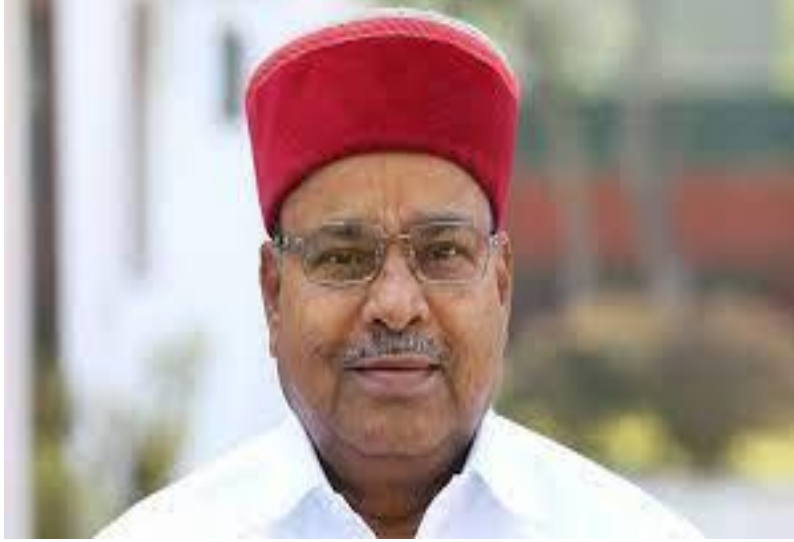
ಸನ್ಮಾನ್ಯ ಶ್ರೀ ಥಾವರ್ ಚಂದ್ ಗೆಲ್ಲೋಟ್ ಕರ್ನಾಟಕ ಸರ್ಕಾರದ ಘನತೆವೆತ್ತ ರಾಜ್ಯಪಾಲರು